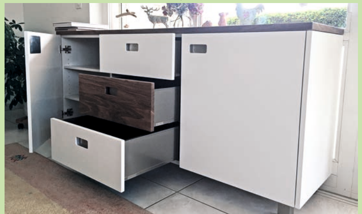
Pascal machen die Arbeiten im Büro ebenso Spass wie das Schreinern. Unten: das Sideboard seiner Abschlussarbeit.