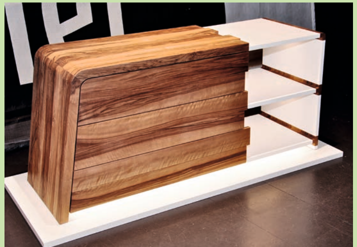
Tobias Koch erlangte Platz zwei in der Gesamtwertung.