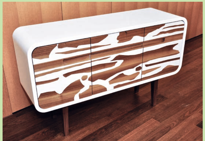
Und auch Sandro Müller ging mit einem Sonderpreis für seine Kreation nach Hause.