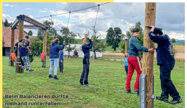
Beim Balancieren durfte niemand runterfallen.