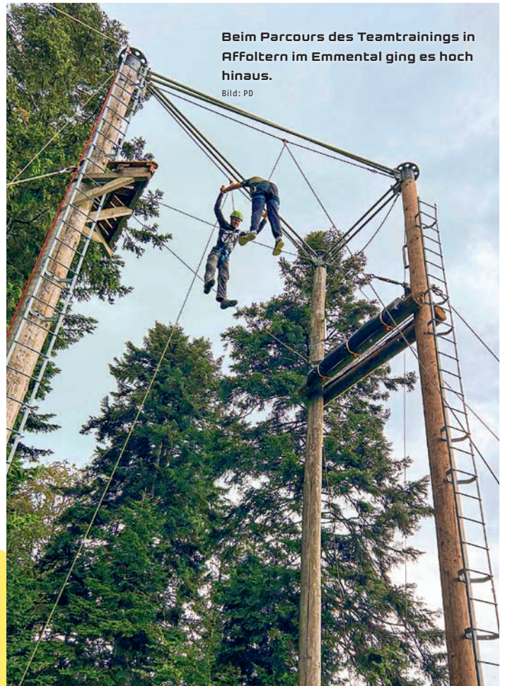
Beim Parcours des Teamtrainings in Affoltern im Emmental ging es hoch hinaus.

Am zweiten Tag musste die angehende Schreinerin Mut beweisen. Die Gruppe besuchte in Affoltern im Emmental einen X-Trail mit verschiedenen Aufgaben. Zum Beispiel mussten alle über ein Draht-